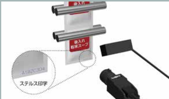
食品包装上のステルス印字検査