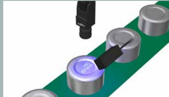
容器底面のステルス印字検査