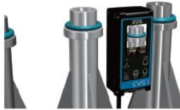
Oリングの色判別・重なり・有無検査